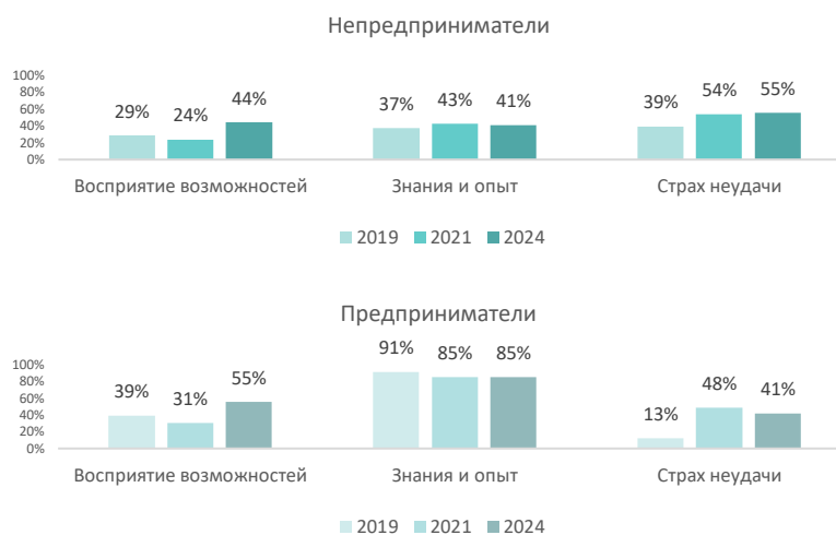
Рисунок 3. Характеристики предпринимательского самовосприятия